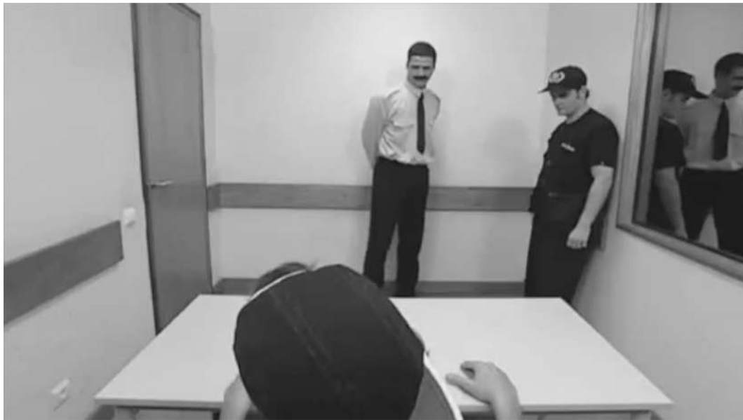
Gato Fedorento Série Meireles (2004)

Organização Associação de Professores de Filosofia