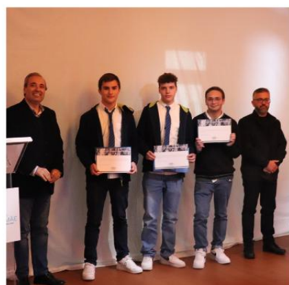
Alunos vencedores com representante da Casa Mãe de Baltar e representante da Apf