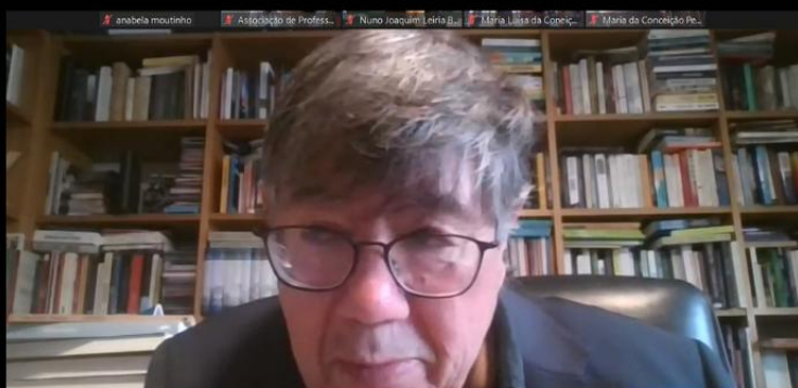
Palestra de Carlos Fiolhais sobre a delimitação entre ciência e não ciência