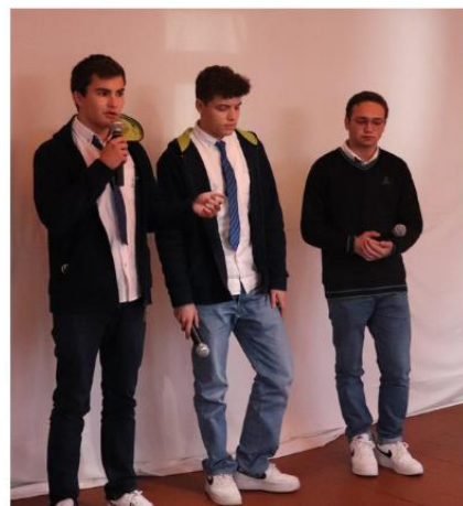
Alunos vencedores da 7.ª edição.

A 2.ª Edição do ciclo de conferências para as escolas realizou-se de janeiro a abril de 2022. Nas Sessões 1 e 2 foram abordados, respetivamente, a possibilidade do redesenho humano e a proposta do pós-humanismo e as implicações decorrentes da utilização da Inteligência artificial. As Sessões 3 e 4 centraram-se na experiência estética, nomeadamente na Música. A Sessão 6 interpelou os participantes no quadro do relativismo cultural face à questão migratória, sendo que a Sessão 5 se dedicou às questões da identidade. Os oradores organizaram as suas intervenções no sentido de implicarem ativamente os participantes nas comunicações. À semelhança da edição de lançamento, participaram escolas de norte a sul do país e a Escola Portuguesa de Macau.