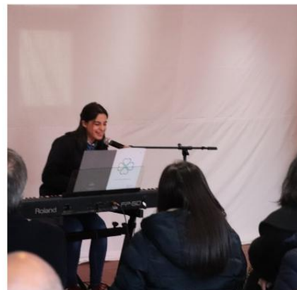
Cerimónia de celebração do Dia da Filosofia