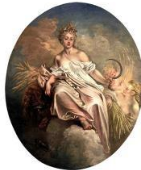
Ceres, deusa mãe, deusa das plantas e dos cereais